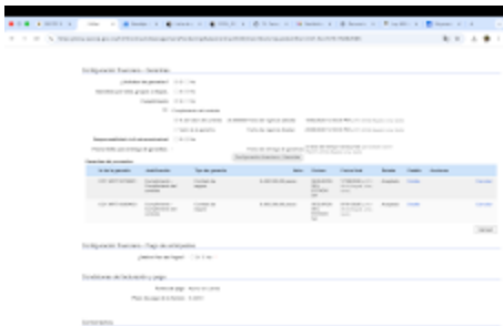
Captura de pantalla 2026-01-15 a las 9.11.20 a.m..png 485K